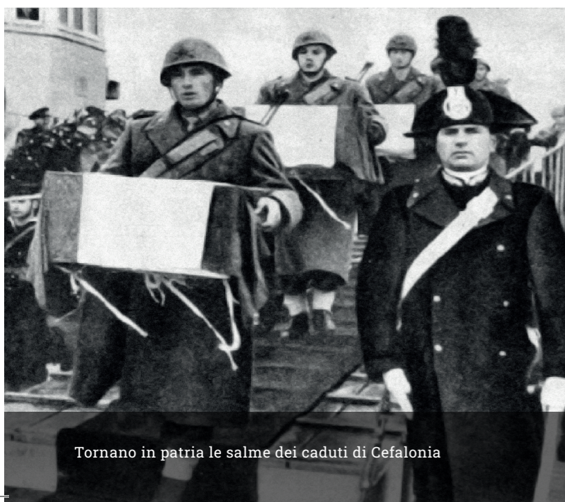
Tornano in patria le salme dei caduti di Cefalonia

Cefalonia, Corfù, Kos, Leros, Dubrovnik, Korça, Kuç-Sarandë-Capo Limione, Sinj-Trilj, Hildesheim, Treuenbrietzen, Kuźnica Żelichowska (Shelkow), Oradour-sur-Glane, Domenikon.