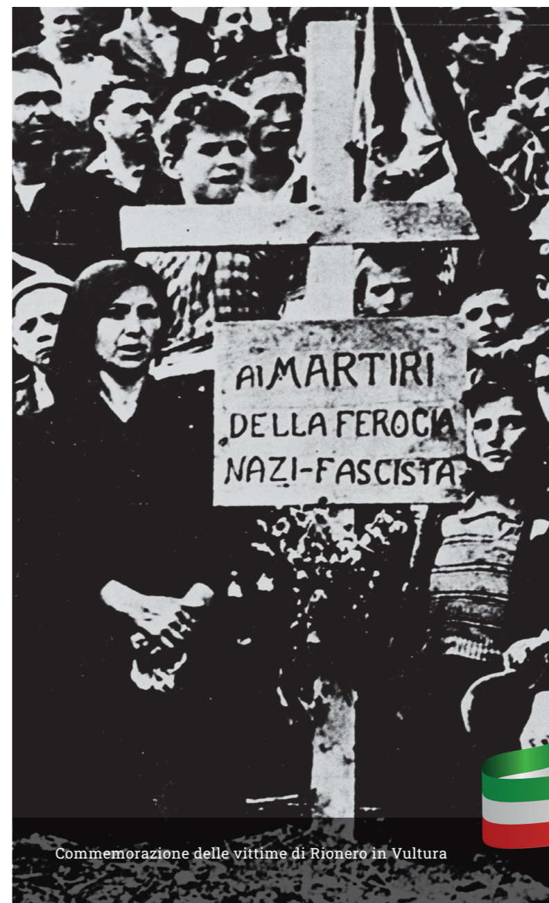
Commemorazione delle vittime di Rionero in Vulture

• Mappa interattiva dei principali luoghi di internamento e deportazione dei militari